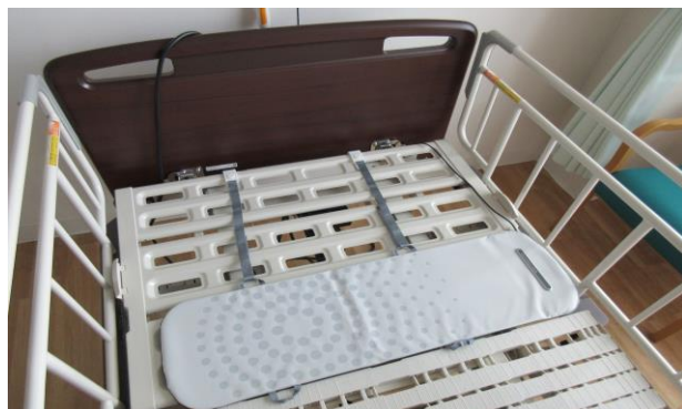
リアルタイムモニター