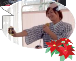
白髭を蓄えたりし好々爺二人現るクリスマス会