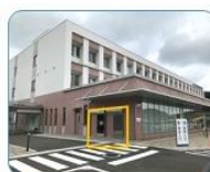
休日夜間 出入口 平日 20:00 ~ 22:00 休日 7:00 ~ 22:00