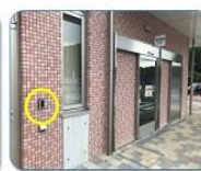
時間外 インターフォン 22:00 ~ 7:00