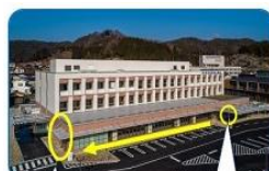
休日夜間 出入口 通常出入口 (正面)